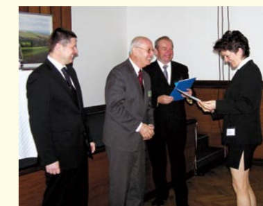
Zástupci společnosti Vitalitas pojišťovna, a.s. převzali certifikát ISO 9001:2000

24. 4. 2008 byl zástupcům Vitalitas předán certifikát ISO 9001:2000