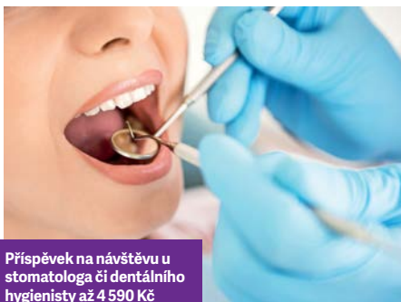
Příspěvek na návštěvu u stomatologa či dentálního hygienisty až 4 590 Kč

NAŠIM KLIENTŮM, KTEŘÍ PEČUJÍ O SVÉ ZDRAVÍ, NABÍZÍME PENĚŽNÍ PŘÍSPĚVKY NA ŠIROKOU ŠKÁLU PREVENTIVNÍCH AKTIVIT: OD OČKOVÁNÍ PŘES DENTÁLNÍ HYGIENU PO PŘÍSPĚVEK NA LETNÍ TÁBORY. A NEJEDNÁ SE O ZANEDBATELNÉ ČÁSTKY.