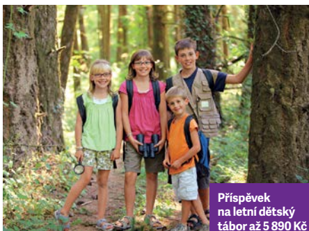
Příspěvek na letní dětský tábor až 5 890 Kč

V Oborové zdravotní pojišťovně se doslova „roztrhl pytel“ s benefity. Jejich nabídka je tak široká, že si v nich vybere prakticky každý klient OZP – současný i budoucí. Čerpat je možné z bohaté nabídky nejrůznějších preventivních programů, příspěvků na zdraví, sportování nebo očkování. Nechybí samozřejmě ani benefity určené speciálně pro ženy, pro muže nebo pro děti.